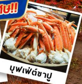
บุฟเฟ่ต์ชาบู