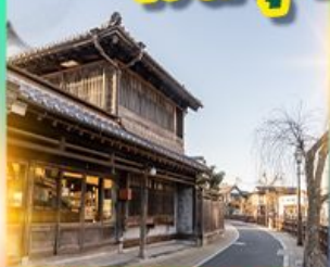
เมืองเก่าซาวาระ