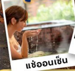
แห่ออนเซ็น