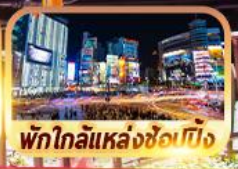
พักใกล้แหล่งช้อปปิ้ง