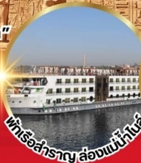
แพเรือสำราญ ล่องแม่น้ำไนล์

*เงื่อนไขเป็นไปตามที่บริษัทกำหนดเท่านั้น*