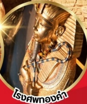
โรงศพทองคำ

บินภายใน 2 เที่ยวบิน จาก CAI - ASW // LXR - CAI