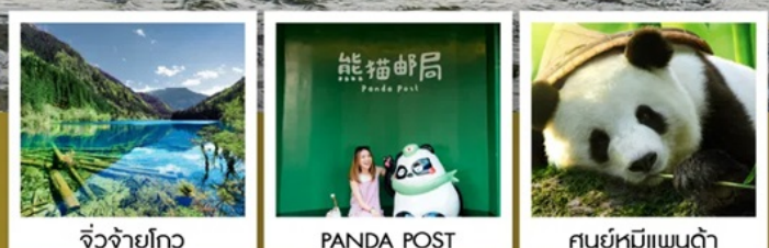
จั๋วจ้ายโกว

จาก 8 ชม. เหลือ 2 ชม. เร็วทันใจด้วยรถไฟความเร็วสูง เติ้งตุ - จั๋วจ้ายโกว