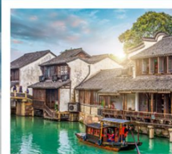
เมืองโบราณอูเจิ้น