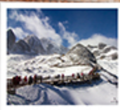
ภูเขาหินมังกรหยก

ลัดขีตนาบอวค์ / ไร่จรงเกแม่บ้านเยงซี / เมืองโบราณเซงกีส้า / วัดลามซงจันหนิง / ซ่งอเกบเส็งกรรโอด เมืองโบราณรุ่งทอ / ภูเขาหินมังกรหยก / ภูเขาพระเจดีย์สีน้ำเงิน / ไร่จางอวี่ใหม่ สะพานมังกรดำ / สวนแก้วลีเจียง / เมืองโบราณลีเจียง ด้าหนักทง / วัดหยวนทง