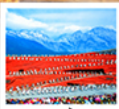
ไร่จางอวี่ใหม่