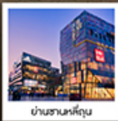
ย่านซานหลี่ตุ่น