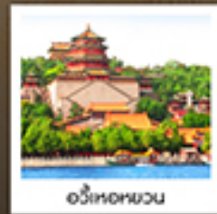
อวี๋เหอหยวน