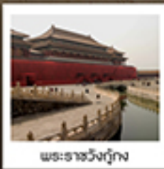
พระราชวังกู่กง