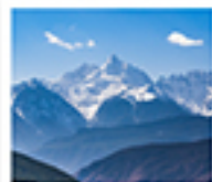
ภูเขาหินปะปี้หม่าง