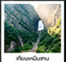
เอวีซีแอนเชินทาวน์

ทรนดึทกษยน / สฟทกัฟว่ฟักว่ฟัก / เขาคีโยนหนึชาน / เรนียงเก้ว / ประตุสวรัท / โธ่งกวงจ้งจ้งกนกว / เขาคีโยนส่วงฮาน สวณจอนพเวเอดอคง / ทาฟวาทกราย / เมืองฟูหลงเจิน / ส้องเฮือตวนสำน้ำต๋อเจียง / เขนเมืองโบราณฝ่งหวงยกนทำกัน