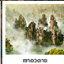
จางเจียเจีย