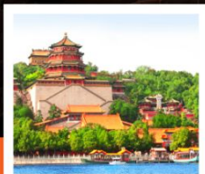
อวิ๋หอหยวน