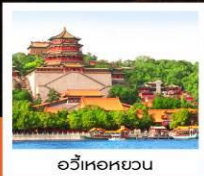
อวิ๋เหอหยวน