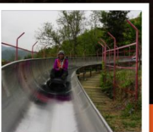
สไลเดอร์ลงจากกำแพงเมืองจีน