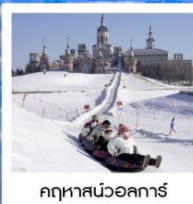
ฤดูหาวสนวอลการ