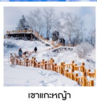
เขากระหญา