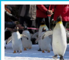
สวนสัตว์นิกะ

วัดคิตสึอิ / ปราสาทโอซาก้า / ย่านชินไซบาชิ ค่องเรือทะเลสาบโทยะ / โทเรียวคะคุ ทาวเวอร์ โกดังอิฐแดงคานโมริ / นั่งกระเช้าภูเขาอาโตะดาเตะ ตลาดเช้าเมืองฮาโกดาเตะ / สวนสัตว์นิกะ ภารินพาร์ค พิพิธภัณฑ์ค่องดนตรี / นาฬิกาไอน้ำโบราณ โรงเป่าแก้วคิตาอิชิ / เนินพระพุทธรเจ้า / มิซึย เอ้าเค็ทท์