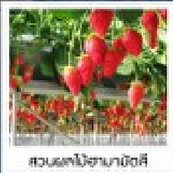
สวนผลไม้ฮามาบิตสึ