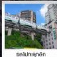
ตมเมืองต้ำจู้

ทัวร์คุณภาพ ไม่ลงร้านฮ้อปปีง • ไม่ขายออฟชั่น