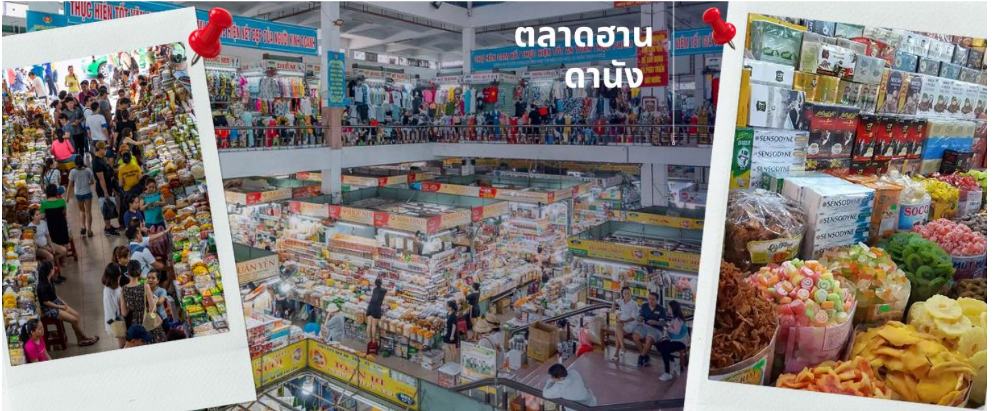
ตลาดชานดาหนัง

สมควรแก่เวลา นำท่านเดินทาง สู่นามบิน Danang International Airport เตรียมตัวเดินทางสู่กรุงเทพฯ ค่า บริการขนมปังเวียดนาม ท่านละ 1 ชิ้น (10) 18.15 น. เห็นฟ้าสู่กรุงเทพฯ โดยสายการบิน VIETJET AIR เที่ยวบินที่ VZ963 19.55 น. ถึงสนามบินสุวรรณภูมิ โดยสวัสดิภาพด้วยความประทับใจ