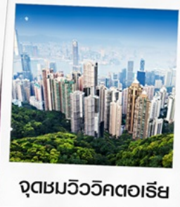
จุดชมวิววิกตอเรีย