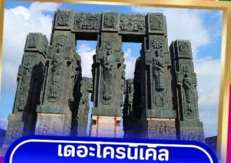
เดอะโครนเคิล ออฟ จอร์เจีย

พิเศษ.. ทดลองชิมไวน์ 3 ชนิด ต้นตำรับของจอร์เจีย