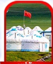
หมู่บ้าน พื้นเมือง