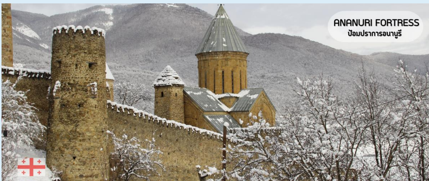
ANANURI FORTRESS ป้อมปราการอนานูรี

แวะชมป้อมปราการอนานูรี (Ananuri Fortress) ป้อมปราการที่มีความเก่าแก่ของประเทศจอร์เจีย สร้างขึ้นในศตวรรษที่ 16-17 ตั้งอยู่ริมแม่น้ำ Aragvi หนึ่งในแม่น้ำสายสำคัญของประเทศจอร์เจียจากมุมสูง มีทิวทัศน์ที่สวยงามของอ่างเก็บน้ำชินวาเลีย (Zhinvali Reservoir) และยังมีเขื่อนซึ่งเป็นสถานที่ที่สำคัญสำหรับนำน้ำที่เก็บไว้ส่งต่อไปยังเมืองหลวง พร้อมใช้ผลิตกระแสไฟฟ้า ที่ทำให้ชาวเมืองทบิลีซีมีน้ำใช้ดื่มใช้ ร่องรอยของซากกำแพงที่ล้อมรอบป้อมปราการแห่งนี้เปรียบเสมือนม่านที่ซ่อนเร้นความงดงามของโบสถ์ 2 หลัง ที่เป็นโบสถ์เก่าแก่ 2 หลัง คือโบสถ์เก่าแก่แห่งพระนางแมรี่ผู้บริสุทธิ์ (The older Church of the Virgin) ส่วนอีกโบสถ์คือโบสถ์ยิ่งใหญ่แห่งอัสสัมชัญ