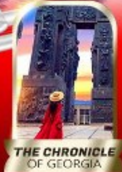
THE CHRONICLE OF GEORGIA