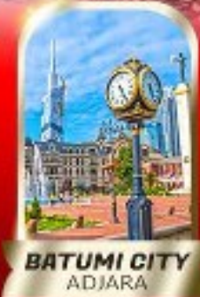
BATUMI CITY ADJARA

เมืองท้ำอูพลิสซิค ■ ป้อมอบาบูรี ■ นั่งกระเช้าชมเมืองบอร์โจมี อนุสาวรีย์มิตรภาพ รัสเซีย-จอร์เจีย ■ โบลด์เกอร์เกดี วิหารจวารี ■ มหาวิทยาลัยสเวทิตสกี