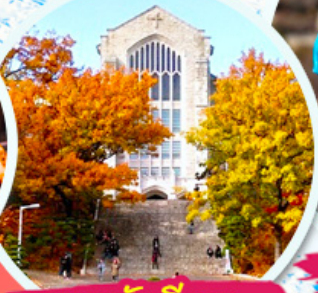
มหาวิทยาลัยฮ็ฮวา