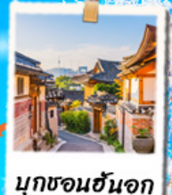
มูกชอนฮันจอก