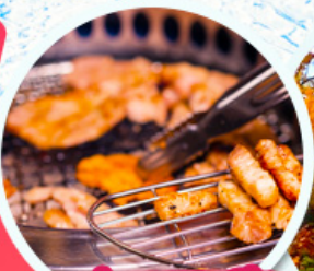
หมูย่างเกาหลี