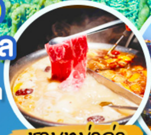
ชาบูหม่าล่า