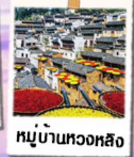
หมู่บ้านทวงหลิง