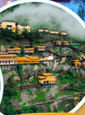
คุมเขาเทวดา