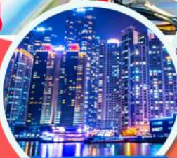
The Bay 101