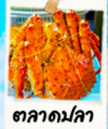
ตลาดมัลลา