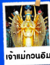
เจ้าแม่กวนอิม