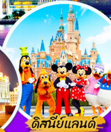
ดิสนีย์แลนด์