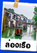
ล่องเรือ