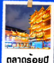
ตลาดร้อยปี