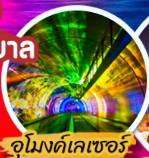
อุโมงค์เลเซอร์