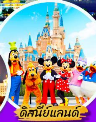
ดิสนีย์แลนด์

***เมนูพิเศษ : เสี่ยวหลงเปา , ชาบูหม่าล่า *** เที่ยวแบบสบายๆ ไม่ลงร้านรัฐบาล ***