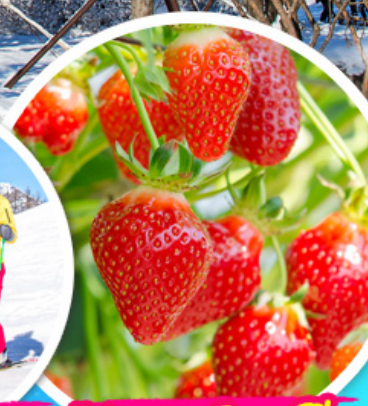
ไร่สตรอว์เบอร์รี่