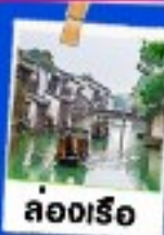
ล่องเรือ