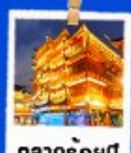
ตลาดร้อยปี