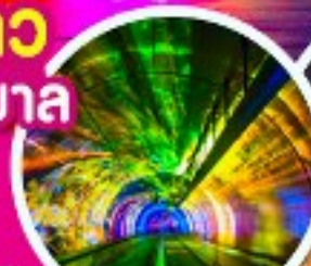
อุโมงค์เลเซอร์