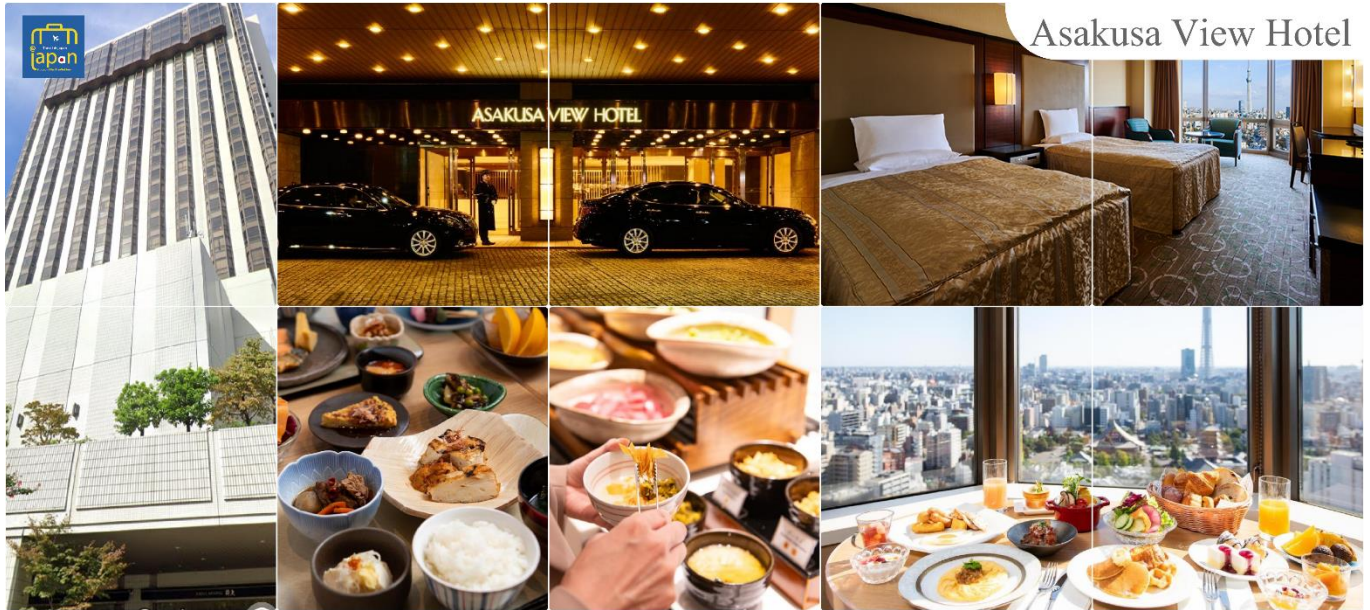
Asakusa View Hotel

พักที่ ASAKUSA VIEW HOTEL หรือเทียบเท่าระดับเดียวกัน