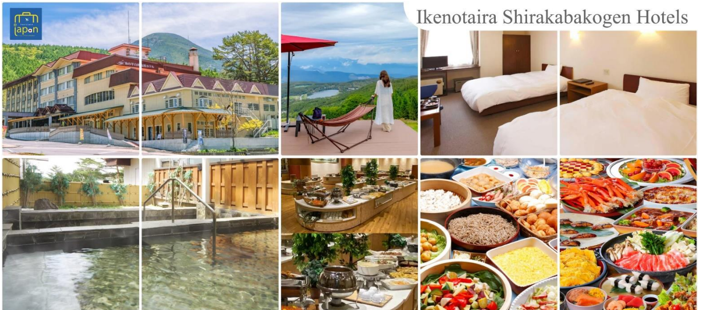
Ikenotaira Shirakabakogen Hotels

หลังอาหารให้ท่านได้ผ่อนคลายกับการแช่น้ำแร่ธรรมชาติ เชื่อว่าถ้าได้แช่น้ำแร่แล้ว จะทำให้ ผิวพรรณสวยงามและช่วยให้ระบบหมุนเวียนโลหิตดีขึ้น