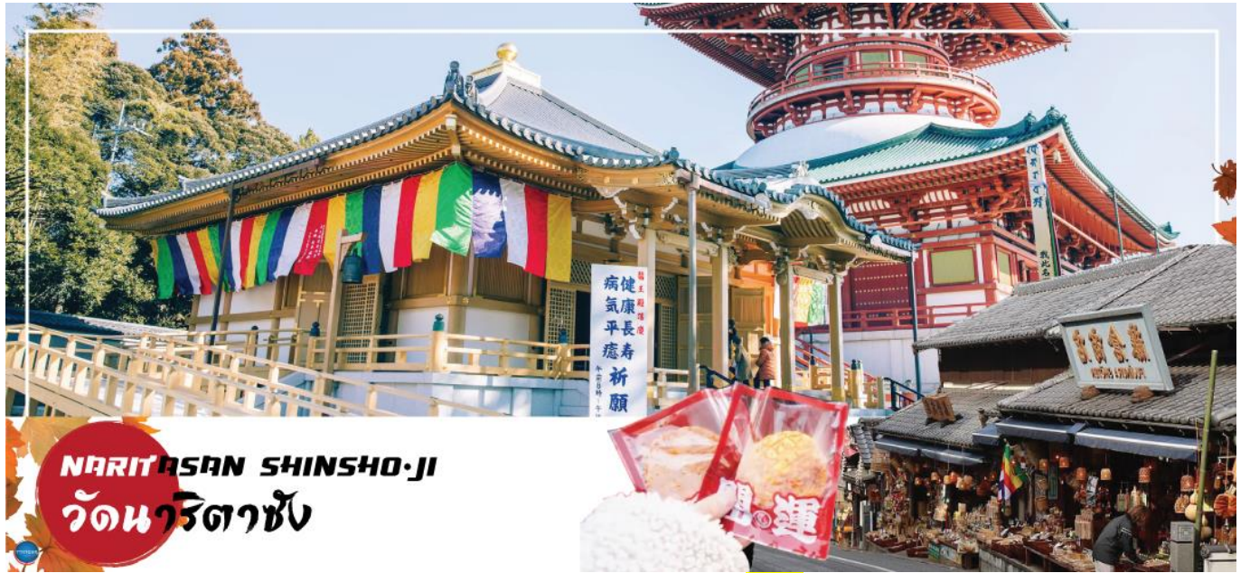
NARITASAN SHINSHO-JI วัดนาริตะชิน

วันที่หก เมืองนาริตะ – วัดนาริตะชิน – ถนนโอมโตะซังโตะ – อีออน มอลล์ – ท่าอากาศยานนานาชาตินาริตะ – ท่าอากาศยานสุวรรณภูมิ