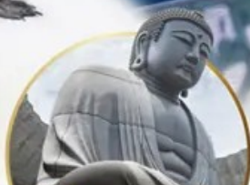
ชมเนินพระพุทธรเจ้า.. Hill of the Buddha

📍 ไฮไลท์!! สนุกสนานกับกิจกรรมทะเลหิมะ ณ ลานสโนว์ เวิลด์ ฮักไซฟาโนรามา เยี่ยมชมเนินพระพุทธรเจ้า ชมความน่ารักเหล่าสัตว์ ณ สวนสัตว์อาซาฮิยาม่า ชมคลองโอดาธา เข้าชมพิพิธภัณฑ์ถ้ำถ้ำสองดนตรี สัมผัสธารน้ำแข็ง ณ หมู่บ้านราเมนอาซาฮิคาว่า ช้อปปิ้งจุใจ กาบุกุคิจิ อีเมอร์รี่!! บุปเฟ่ต์ซาบู่ และซาบูยูกิ