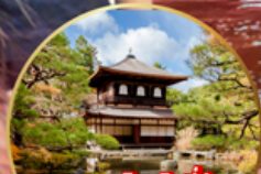
ชมสวนสไตลญี่ปุ่น.. Ginkakuji Temple