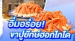
อิมมอร์ออย! ทาปูยักษ์ฮอกไกโด