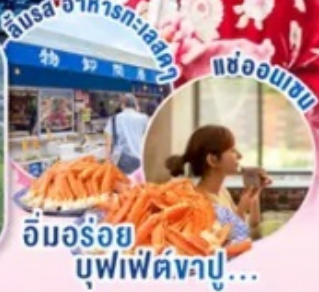
อิมอร้อย บุฟเฟ่ต์งาปู... และช้อปปิ้ง

📍 โสโถ! นั่งกระเช้าชมวิวทิวทัศน์ขึ้นภูเขา Omuro (ตามรอยอนิเมะชื่อดัง) ชมซากุระ ณ หมู่บ้านโอชิโนะฮักโกะ วิวภูเขาไฟฟูจิสวยงามติดกับพื้นหลังสีฟ้าเขียว เมืองอาโอยุ จ.อิบารากิ เมืองซายาฮาดทะเลญี่ปุ่นตะวันออก ช้อปปิ้งใจ ชินจูกุ พร้อมเช็คอิน แลนด์มาร์คแห่งใหม่ แมวยักษ์ 3 มิติ บุฟเฟ่ต์งาปู และผ่อนคลายกับการแช่น้ำแร่ธรรมชาติ (ออนเซน)