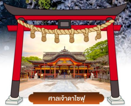
ศาลเจ้าดาโชฟุ