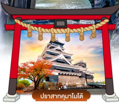
ปราสาทคุมาโมโตะ