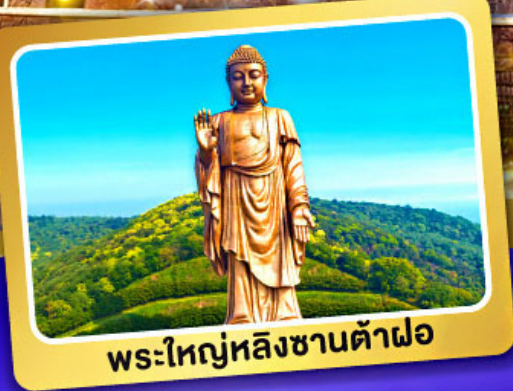
พระใหญ่หลังซานต้าฝอ