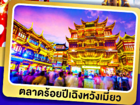
ตลาดร้อยปีเจิ้งหวังเมี่ยว