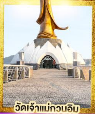
วัดเจ้าแม่กวนอิม