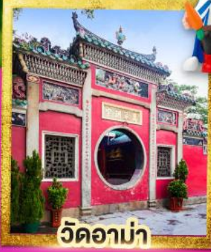
วัดอาบ่า