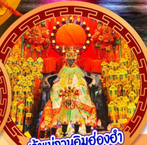
เจ้าแม่กวนอิมฮ่องฮ่า

นมัสการเจ้าแม่กวนอิมฮ่องฮ่า หมุนกังหันรับโชคลากเงินทองที่วัดแชงหมิว ขอพรความรักกับผู้เต่าจันตรา วัดหวังต้าเซียน