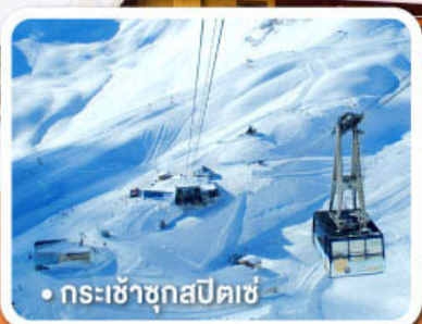
กระเช้าชุกสปีตเซ่