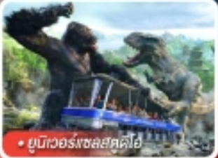
ยูนิเวอร์สอลสตูดิโอ