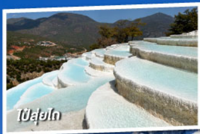
ปี๋สุ่ยโต

เที่ยวครบทุกไฮไลต์ • ไม่ลงร้านช้อปปิ้ง • พักโรงแรม 4 ดาว