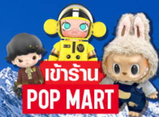
เข้าร้าน POP MART