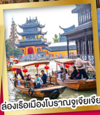
ล่องเรือเมืองโบราณจูเจียเจียว