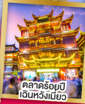
ตลาดร้อยปี เงินหวังเหมียว