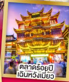
ตลาดร้อยปี เงินหั่งเมี่ยว