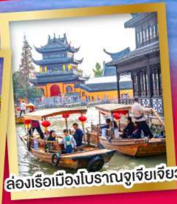
ล่องเรือเมืองโบราณจูเจียเจียว