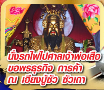
นั่งรถไฟไปศาลเจ้าพ่อเสือ ขอพรธุรกิจ การค้า ณ เชียงมู๊ซิว ชิวเกา