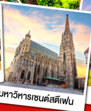
มหาวิหารเซนต์สตีเฟน