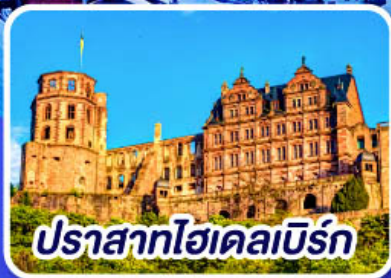
ปราสาทไฮเดลเบิร์ก