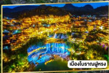
เมืองโบราณฝูหรง

เฟิ่งหวง ฝูหรงเจิ้น มนตร์งลิ่งแห่งขุนเขา และเมืองโบราณ 5 วัน 4 คืน