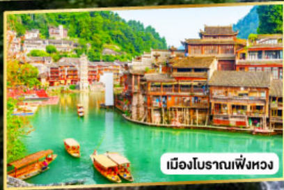
เมืองโบราณเฟิ่งหวง