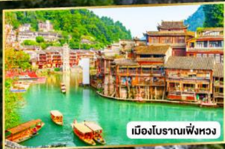
เมืองโบราณเฟิ่งหวง