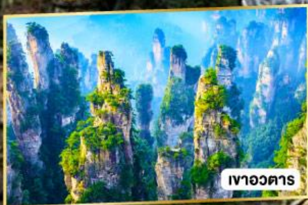
เขาวงตาร