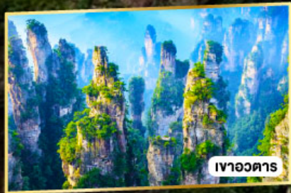
เวาอวดาร