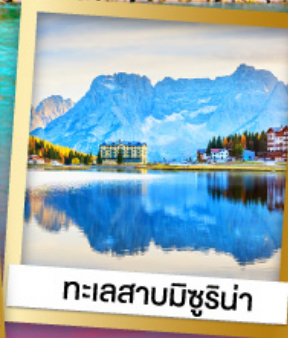
ทะเลสาบมิซูริน่า