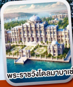
พระราชวังโดลมาบาเซ