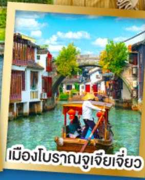
เมืองโบราณจูเจียเจี้ยว