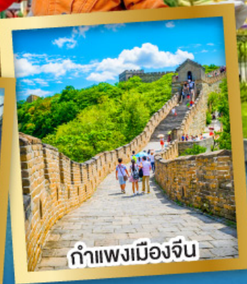
กำแพงเมืองจีน