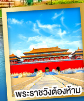
พระราชวังต้องห้าม