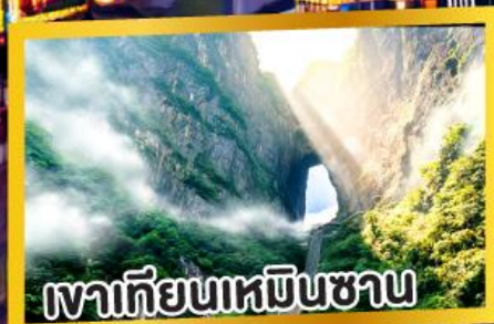
เขาทียนเหมินซาน