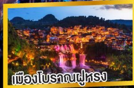
เมืองโบราณฟูหรง