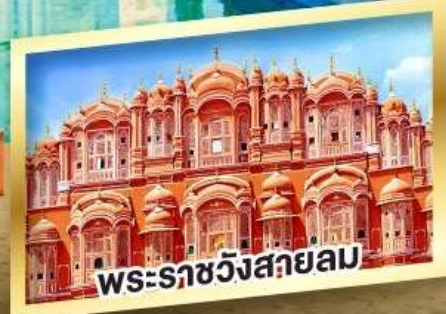
พระราชวังสายลม