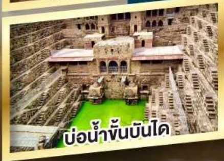
บ่อน้ำชั้นบันได