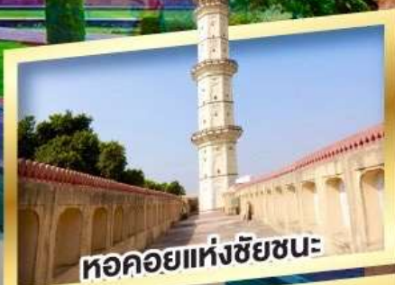
หอคอยแห่งชัยชนะ