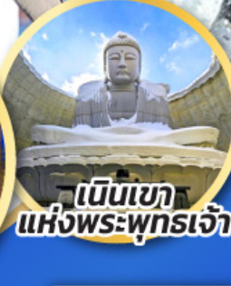
เป็นเขาแห่งพระพุทธรเจ้า

ชมความน่ารักของสัตว์ต่างๆ ที่พิพิธภัณฑ์สัตว์น้ำโอตารุ